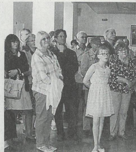
L'un des moments forts de cette année 2018 à Bideford à la fin du mois de mai.